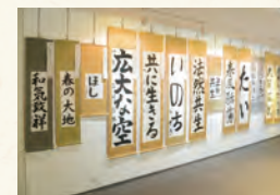
全国青少年書道展

和順会館の地下一階展示スペース「ギャラリー和順」では期間中、浄土宗児童教化連盟主催の書道展が開催されます。